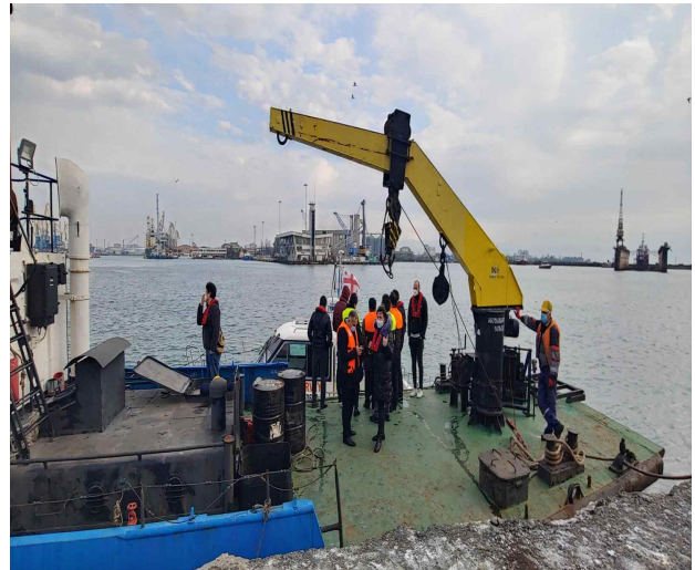
조사 대상지역 현장답사