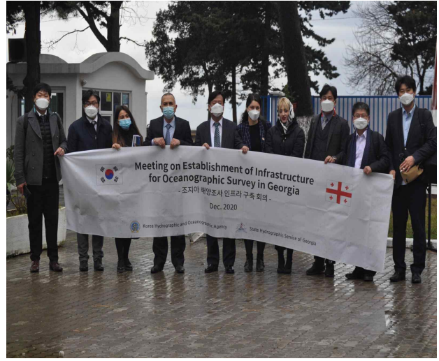
양국 실무자간 실무협의