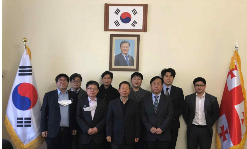
주조지아 한국대사관 초청방문 및 오찬